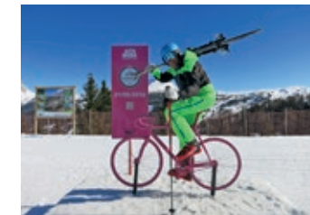
Freunde des 111er-Bieres