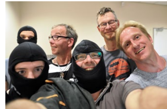
Zwischendrin ... Entspannung beim Kart-Fahren