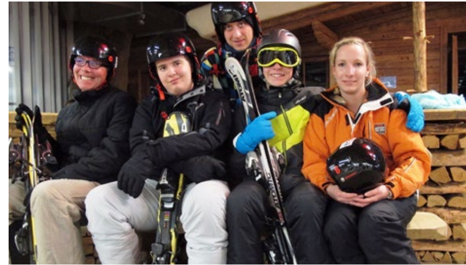
Warten bis auch wirklich der Letzte seine Schuhe an hat...