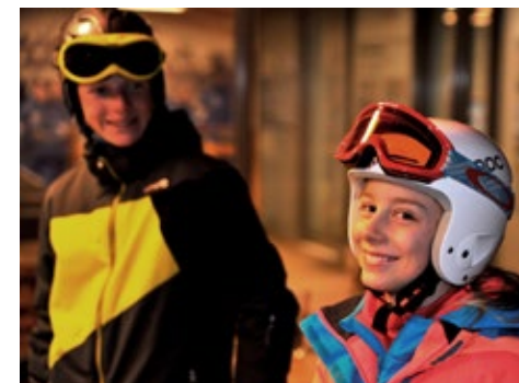
Leonie hat Grund zum Strahlen